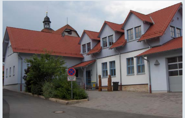
In der Ortsmitte Langenfelds gelegen: das Dorfgemeinschaftshaus.

Personal und Ausrüstung werden derzeit von der Stützpunktfeuerwehr verwaltet, die Jugendfeuerwehrmitglieder übernehmen die Kameraden aus Kaltenborn. Alljährliches Highlight in Langenfeld ist das von der Kirchengesellschaft organisierte traditionelle Walpurgisfeuer, das zur Walpurgisnacht am 30. April stattfindet.