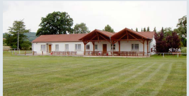
Der Sportplatz Langenfeld mit Sportlerheim.