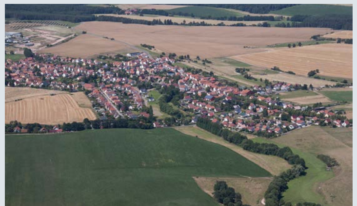
Luftaufnahme des Ortsteiles Langenfeld.